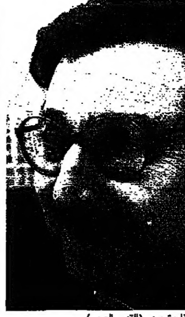
زيد الشيبخ (القدس العربي)